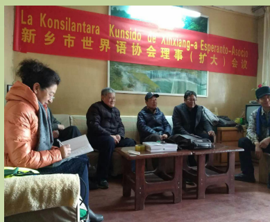
新乡市世界语协会理事扩大会议