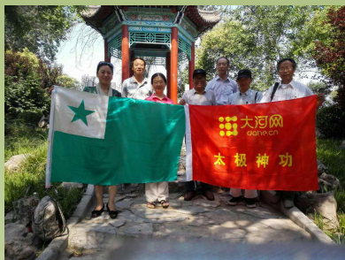
郑州 E 者在新乡与当地同志合影