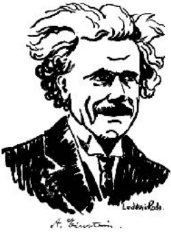
Portrait d'Albert Einstein par Ludovic Rodo ( Ludovic-Rodo Pissarro ) cinquième enfant de Camille Pissarro.

14 juin 1923 : Albert Einstein, accepte la présidence d'honneur du congrès mondial de SAT dont la langue de travail est l'espéranto et dont la devise est "SAT-anoj kutimiĝu al eksternacia sent-pens-kaj agad-kapablo !" 1